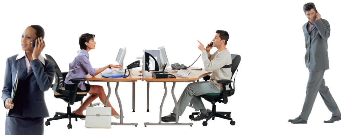
חבילה כוללת של קול + אינטרנט + נתונים